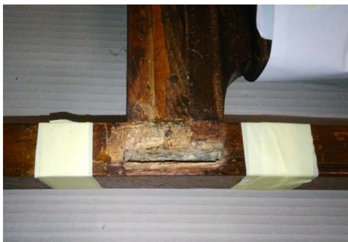
Entfernung alter Leimreste